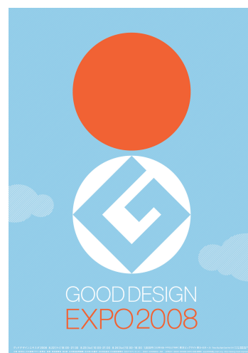
グッドデザインエキスポ 2008 メインビジュアル (アートディレクション：永井一史)

名称 グッドデザインエキスポ 2008 (GOOD DESIGN EXPO 2008) 会期 2008年8月22日(金)～24日(日) 18時～21時(8/22)、10時～21時(8/23)、10時～16時(8/24) 会場 東京ビッグサイト 東展示棟 5～6ホール 入場料 1,000円(中学生以下無料) 主催 財団法人日本産業デザイン振興会 後援 経済産業省、東京都、日本貿易振興機構、日本商工会議所、 日本放送協会、日本経済新聞社、日本アセアンセンター、 ICSID、ICOGRADA、JKA 主な企画 2008年度グッドデザイン賞二次審査対象デザインの展示 デザインコミュニケーション(企業・学校のブース出展) 特設ステージ(グッドデザイン賞公開審査、デザイナーズトーク、 出展者プレゼンテーション) デザインショップ・カフェエリア 他 出展対象者 国内外の企業、団体、教育機関など約1,200社 来場者数見込み 約45,000人(昨年度実績約37,000人) アートディレクション 永井一史 スペースクリエイティブディレクション 谷川淳司(株式会社JTQ)