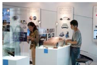
昨年度デザインコミュニケーション出展イメージ

大阪芸術大学、京都工芸繊維大学、京都精華大学、多摩美術大学、東北芸術工科大学、千葉大学、千葉工業大学、武蔵野美術大学 (学校による出展: 全 8 ブース)