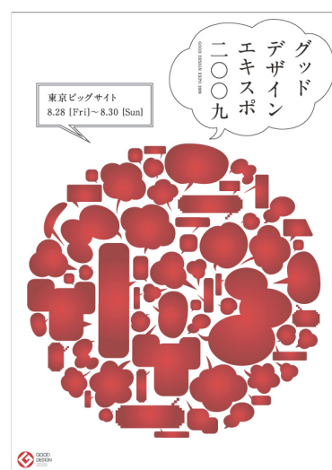
グッドデザインエキスポ 2009 メインビジュアル デザイン: タイクーングラフィックス