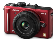
デジタルカメラ パナソニック LUMIX DMC-GF1C パナソニック株式会社