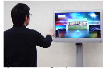
ジェスチャーユーザインタフェース ジェスチャー操作テレビ 株式会社 日立製作所