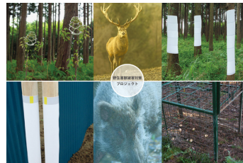
忌避材・誘引材 マイクロカプセルを応用した 野生害獣被害対策プロジェクト 法政大学デザイン工学部システムデザイン 学科大島研究室