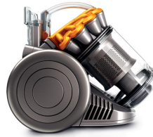
サイクロン掃除機 DC26 タービンヘッド エントリー ダイソン株式会社