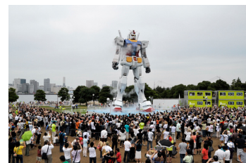
GREEN TOKYO ガンダムプロジェクト GREEN TOKYO ガンダムプロジェクト 実行委員会