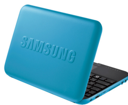
ミニノート型パソコン N310 サムスン電子株式会社