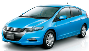
乗用車 インサイト 本田技研工業株式会社