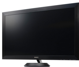
地上・BS・110度CS デジタルハイビジョン 液晶テレビ 〈ブラビア〉ZX1 シリーズ ソニー株式会社