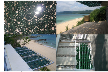
フラクタルひよけ フラクタルひよけで快適な OUT DOOR LIFE を 株式会社ロスフィー