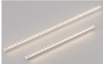
長寿命の極細ランプを使用した 建築化照明器具 プラスシーライン MMC07101/09101 シリーズ NEC ラइटニング株式会社