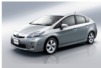
ハイブリッド乗用車 プリウス トヨタ自動車株式会社