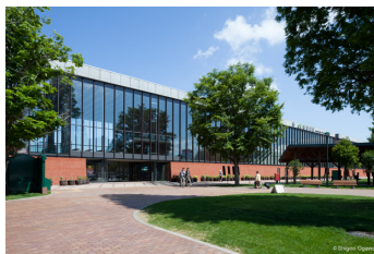
駅舎および複合施設 岩見沢複合駅舎 株式会社ワークヴィジョンズ + 岩見沢レンガ プロジェクト事務局