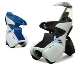
小型3輪自動車 i-REAL (Ann- 案内仕様、Kei- 警備仕様) トヨタ自動車株式会社

10月1日から、グッドデザイン賞ウェブサイトにて2009年度受賞対象の情報を公開します。各受賞対象の名称や受賞者名、概要、デザインの評価ポイントなどの情報が閲覧できます。（なお、一部に商品の発売日の関係などにより、10月1日時点で受賞情報が公開できない対象があります。これらの受賞対象については、後日情報を公開します）