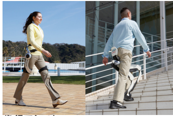
歩行アシスト Honda 歩行アシストコンセプト 本田技研工業株式会社

将来の「もの」や「サービス」のあり方を描き出すデザイン提案など、近未来の生活を示唆する「まだ実現されていないものごと」を持続可能な社会の実現という視点から評価し、推奨します。