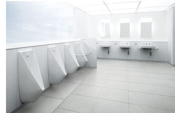
公共トイレ レストルーム アイテム 01 TOTO 株式会社