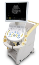
汎用超音波画像診断装置 デジタル超音波診断装置 HI VISION Preirus 株式会社日立メディコ