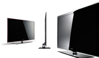
46型 LED 液晶テレビ LED 7000 サムスン電子株式会社