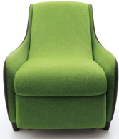
マッサージチェア Panasonic EP-MS40 パナソニック電工株式会社