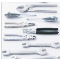
工具 / ALUTOOL