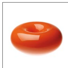
加湿器 / ±0