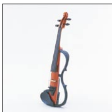
サイレントバイオリン / YAMAHA