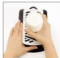
ダイコングレーター / OXO