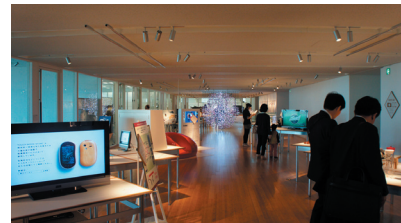
現在開催中の受賞展の様子

結果発表：11 月 9 日（水）「2011 年度グッドデザイン賞 表彰式」で発表