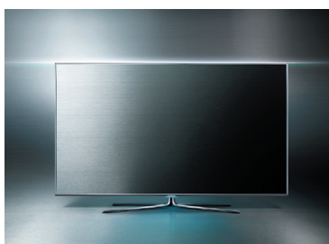
3D SMART LED TV UN55D7000/7900/8000 Samsung Electronics Co.,Ltd