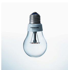
LED電球 Panasonic LDAHV4LCG パナソニック株式会社