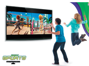
ゲームシステム Kinect™ 日本マイクロソフト株式会社