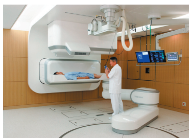
重粒子線照射システムおよび粒子線治療施設 株式会社東芝+独立行政法人放射線医学総合研究所+株式会社日本設計