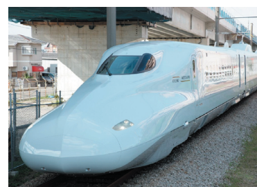
鉄道車両 N700系7000/8000番代新幹線電車 西日本旅客鉄道株式会社+九州旅客鉄道株式会社