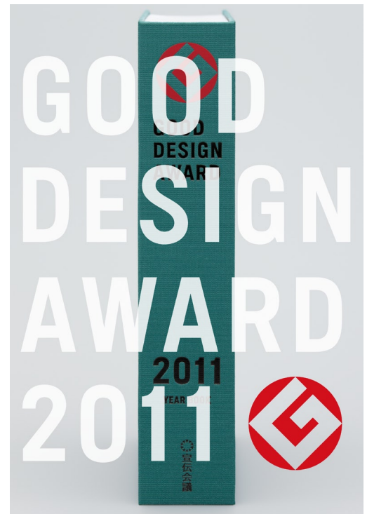
『GOOD DESIGN AWARD 2011』告知用ビジュアル

大賞、金賞受賞作はデザイナー・開発者のインタビューを収録。取材を通じて評価に繋がったポイントの裏側や開発秘話に迫りました。また、そのほかのグッドデザイン賞についても、一般公開されているすべての受賞対象、約1,000点の情報を網羅。審査委員講評も多数掲載し、まさに一年間のグッドデザインの総集編です。