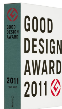
一般販売用は スリーブケース入り