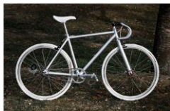
自転車[UTB-0] 有限会社ビゴール・カタオカ