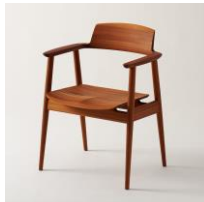
ダイニングチェア[KISARAGI] 飛騨産業株式会社