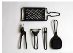
台所用具[エフディー スタイル] プリンス工業株式会社