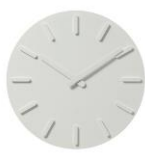
壁掛け時計 プラマイゼロ株式会社