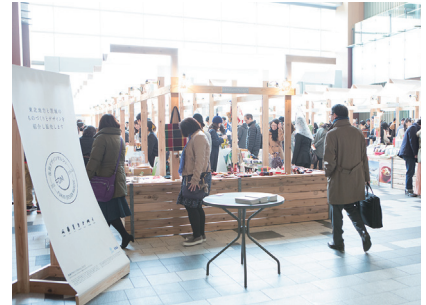
JDP復興デザインマルシェ(2016年3月予定)