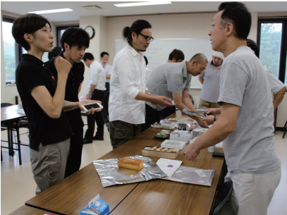
デザイナーと事業者の交流会(2015年7月)