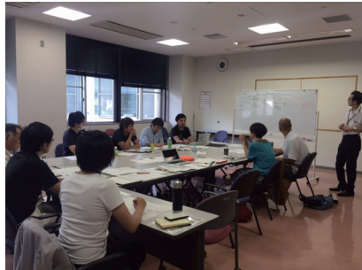
デザイナーによる提案検討会議(2015年8月)