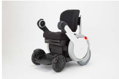
2015年度グッドデザイン大賞「WHILL ModelA」

会 場：GOOD DESIGN Marunouchi（千代田区丸の内3-4-1 新国際ビル1F）