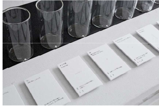
VISION GLASS NO PROBLEMによる前回の展示風景