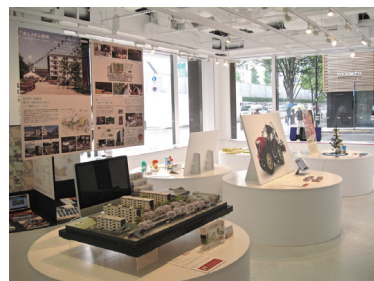
昨年度の会場風景