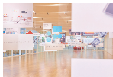
昨年度の会場風景