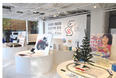
昨年度の会場風景