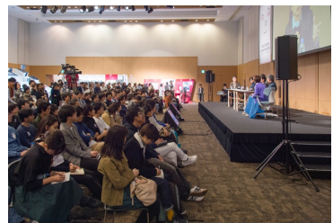
写真はすべて2018年度の会場風景です。