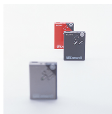
1981年度 WALKMAN WM-2