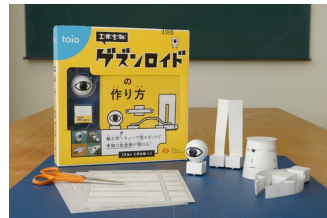
toio™ 専用タイトル [工作生物 ゲズンロイド] アナログとデジタルを組み合わせた動く紙工作キット