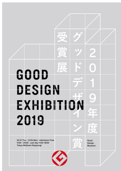
GOOD DESIGN EXHIBITION 2019 イメージビジュアル(デザイン:色部義昭)