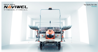
田植機 [ナビエル NW8S] 高精度な田植えを実現するハイテク米生産機