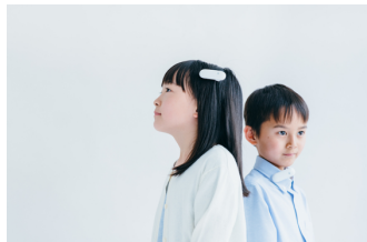
音知覚装置 [Ontenna (オンテナ)] 振動や光によって、耳が不自由な人など、すべての人がコミュニケーションをとることのできるツール