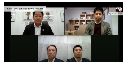
2020年度のオンライン配信イベントの様子

※ 詳しい配信日時・内容・視聴方法については、特設ウェブサイトをご参照ください。