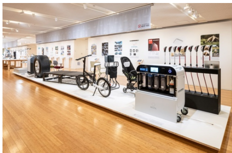
2020年度展示会場風景

公益財団法人日本デザイン振興会(会長：川上元美、所在地：東京都港区)は、10月20日(水)発表の今年度のグッドデザイン賞を紹介するイベント「GOOD DESIGN SHOW 2021」を、10月20日(水)から11月21日(日)まで、特設ウェブサイト( http://promo.g-mark.org/ )と実会場での展示を中心に開催します。