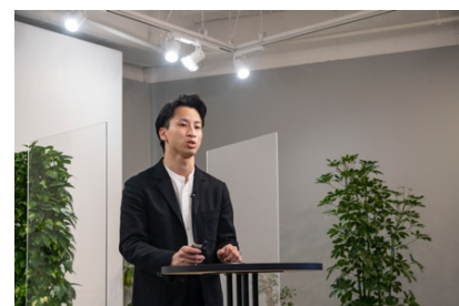
2020年度の最終プレゼンテーションの様子

今年を代表する最も優れたデザインである「グッドデザイン大賞」候補者による最終プレゼンテーションの様子を後日アーカイブ公開します。