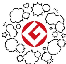
GOOD DESIGN SHOW 2021