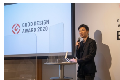
2020年度のベスト100プレゼンテーションの様子

すべての受賞作品の中から、未来を示唆するデザインとして特に高い評価を受けた「グッドデザイン・ベスト100」受賞デザイナー100人によるプレゼンテーションを公開します。