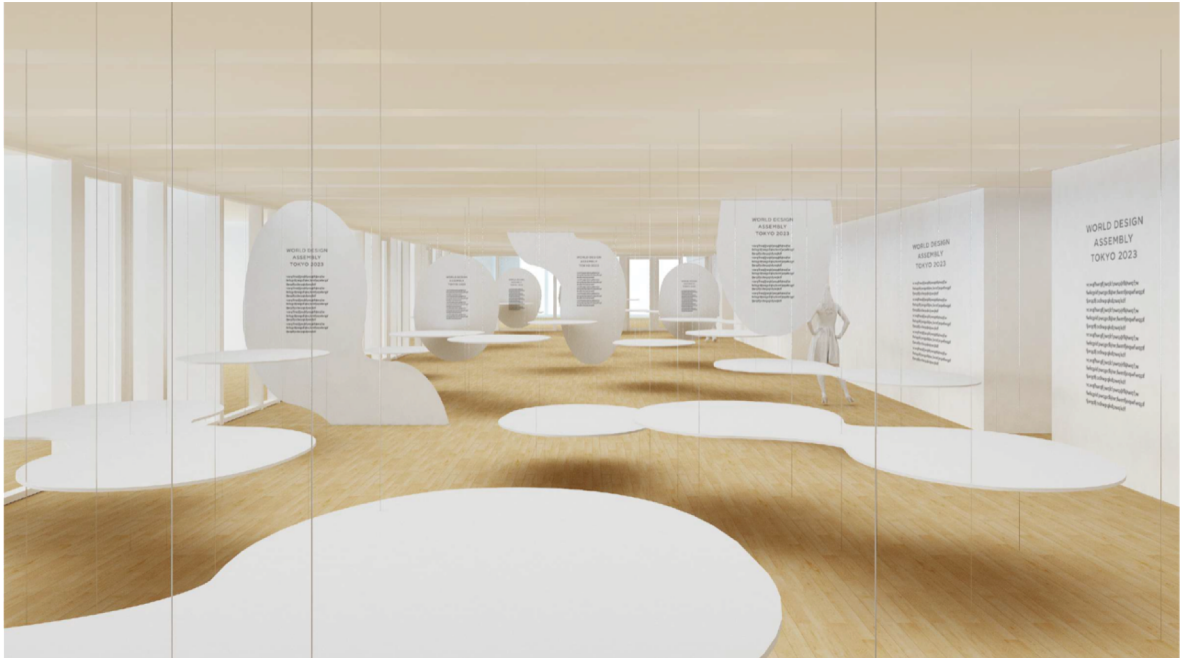
展示会場イメージ