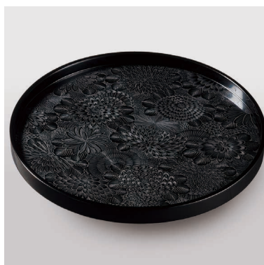
能登半島震災を乗り越えた、輪島塗と珠洲焼の作品を特別展示（写真はイメージです）