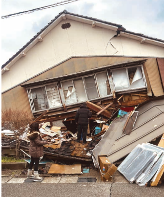
能登半島震災で全壊した輪島塗の塗師屋の事務所。

約9回にわたって行われる特別座談会では、学生や職人、また行政やデザインに携わる人々などを様々な年代、国籍、業種を超えたスピーカーたちを招き、未来を創る復興のあり方や持続可能な地域経済、そして伝統工芸の未来を構築するビジョンや、それぞれの気付きや想い、疑問や提案を共有・発信します。座談会はオンライン配信およびアーカイブ化され、会場でグラフィックレコーディングとして紹介します。本質をつく疑問や前向きなヒントがたくさん詰まったトークは、未来を考える上で新鮮な気づきを与えてくれるはずです。