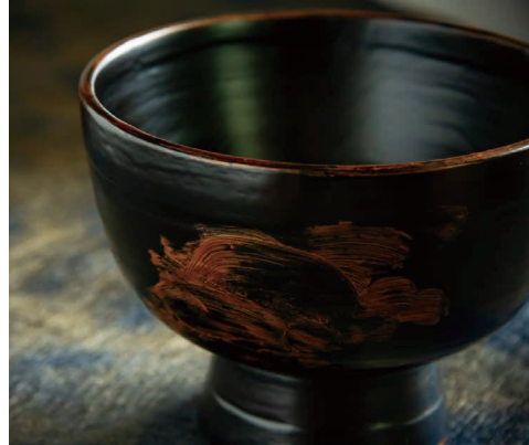
堅牢さと美しさを兼ね備えた輪島塗も、試練の時を迎える。