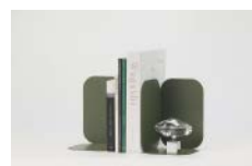
「ブックエンド Mass」 (2021年度グッドデザイン賞)