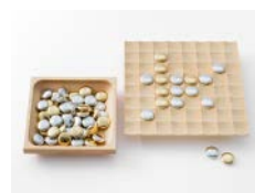
「Teyney さざ波」 (2019年度グッドデザイン賞)