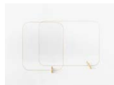
「パーティション Teyney Q」 (2021年度グッドデザイン賞)