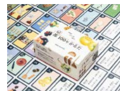
「京都100年かると」 (2021年度グッドデザイン賞)