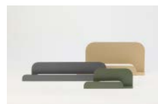
「ブックスタンド Puska」 (2021年度グッドデザイン賞)