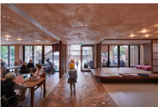
複合型福祉施設「深川えんみち」 社会福祉法人 聖教主福祉会+NPO法人 地域で育つ元気な子+JAMZA (受賞番号：24G151229)