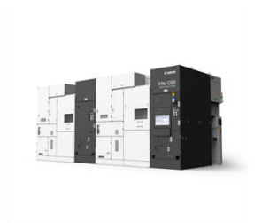
半導体製造装置「FPA-1200NZ2C」 キヤノン株式会社 (受賞番号：24G080574)