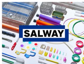
再生処理プロダクトブランド「SALWAY」 株式会社名優 (受賞番号：24G161324)