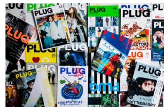
雑誌「プラグマガジン」 有限会社サーブ (受賞番号：24G161347)