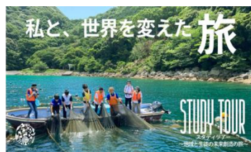
スタディツアー～地域と生徒の未来創造の旅～ 学校法人新渡戸文化学園 (受賞番号：24G181453)