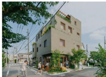
障害者シェアハウス+シェア店舗「はちくりはうす」 株式会社ブルスタジオ+竹村真紀 + 特定非営利活動法人はちくりうす (受賞番号：24G120995)