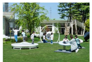
遊具研究プロジェクト「RESILIENCE PLAYGROUND プロジェクト」 株式会社ジャクエツ (受賞番号：24G191506)