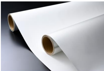
放射冷却素材「SPACECOOL」 SPACECOOL株式会社 (受賞番号：24G080641)