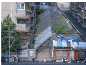
都市空間再生プロジェクト「CACP "Designing?"」 YIIIE Co., Ltd. (受賞番号：24G151253)