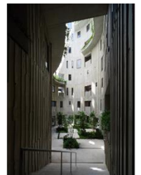
集合住宅「天神町place」 株式会社寿企業+有有限会社伊藤博之建築設計事務所 (受賞番号：24G131092)